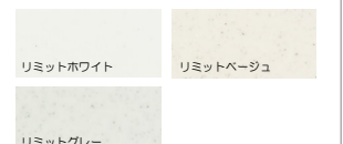
リミットホワイト