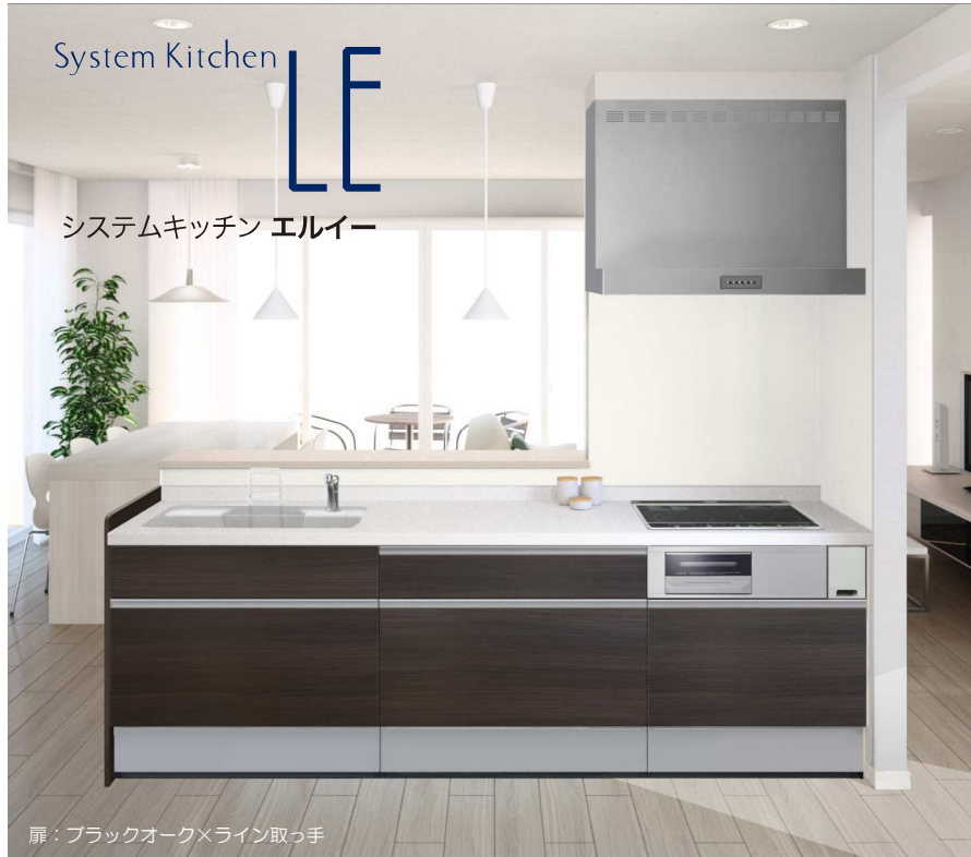
扉：ブラックオーク×ライン取っ手